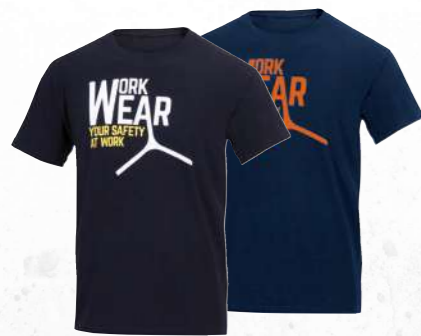
LAZIO S → 3XL