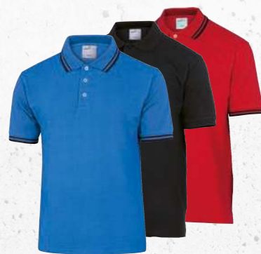
AGRA S → 3XL