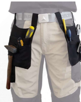
MAPOC ROZMIAR UNIWERSALNY