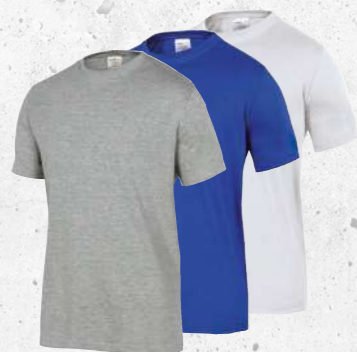
NAPOLI S → 3XL