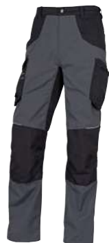
PANOSTRPA XS → 3XL PANOSTYLE