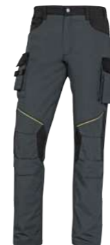
PALIGPA S → 3XL PANOSTYLE