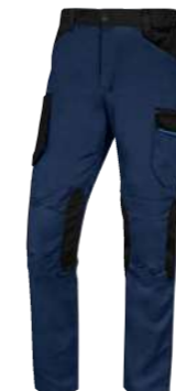
* M6PAN XS → 3XL PANOSTYLE