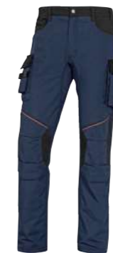
PALIGPA S → 3XL PANOSTYLE