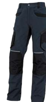
PANOSTRPA XS → 3XL PANOSTYLE