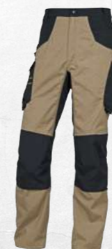
* M6PAN XS → 3XL PANOSTYLE