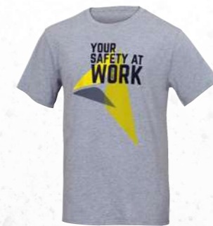
ROMA S → 3XL