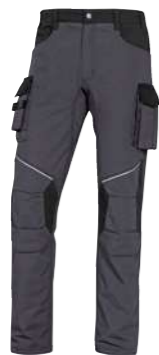
* M6PAN XS → 3XL PANOSTYLE