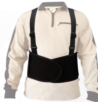
CEINTO4 M → XL