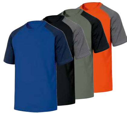
GENOA S → 3XL