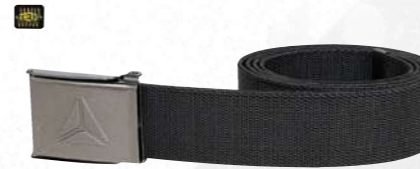
REEF ROZMIAR UNIWERSALNY