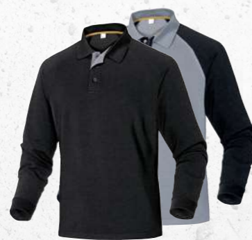
TURINO S → 3XL