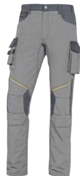
* M6PAN XS → 3XL PANOSTYLE