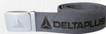
ATOLL ROZMIAR UNIWERSALNY