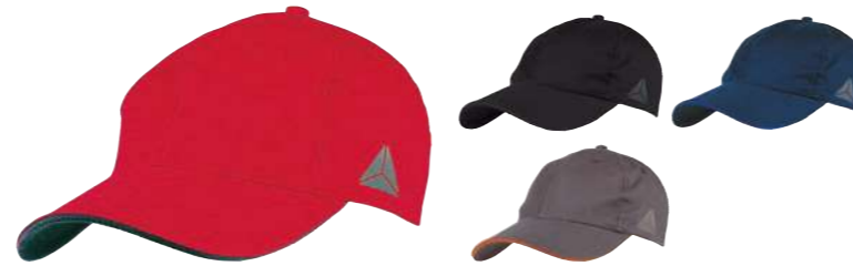
VERONA ROZMIAR UNIWERSALNY