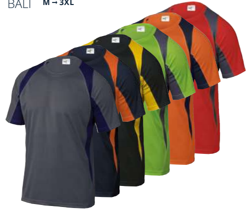
BALI M → 3XL