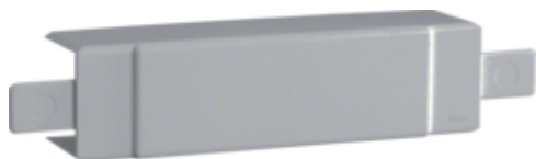
tehalit.LF/ateha Element T/X 40x40mm szary