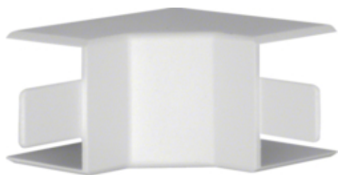
tehalit.LF/ateha Kąt wewnętrzny 30x30mm biały