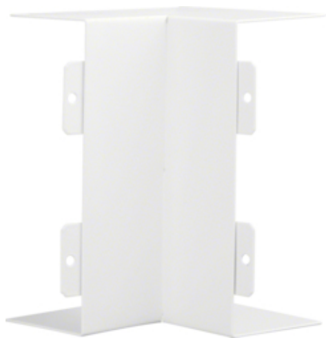
tehalit.LFS Kąt wewnętrzny, 60x150mm, biały