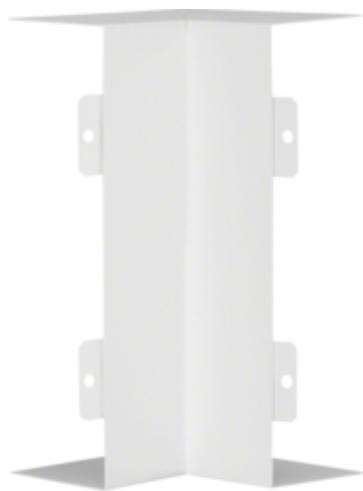
tehalit.LFS Kąt wewnętrzny, 60x200mm, biały