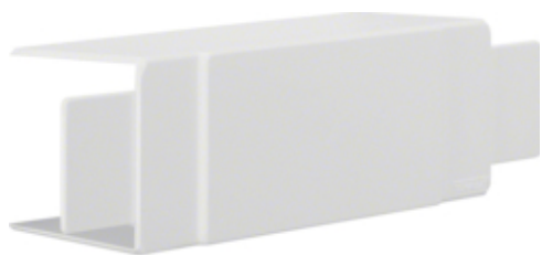
tehalit.LF Element T/X, 60x60mm, biały