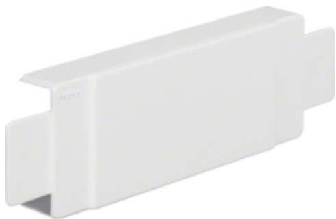
tehalit.LF Element T/X 18x45mm biały