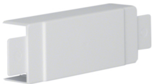
tehalit.LF Element T/X 30x45mm jasnoszary