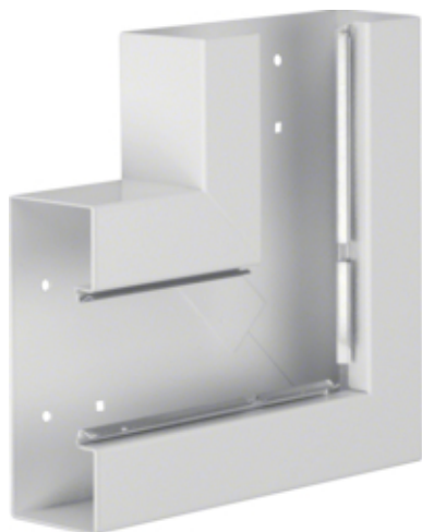
tehalit.BRS Kąt płaski 65x170, stalowy, biały