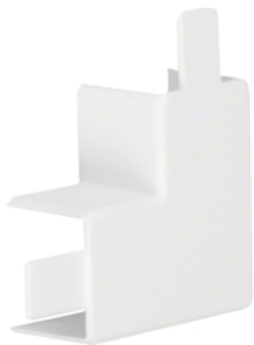
tehalit.LF/ateha Kąt płaski 30x30mm biały